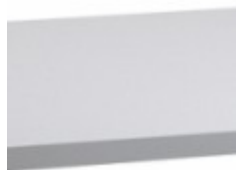
Deska lamino v ceně výrobku