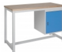
Kontejner skříňka +2 689 Kč