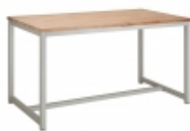
Bez kontejneru v ceně výrobku