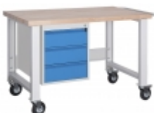
Kontejner 3 zásuvky +3 921 Kč