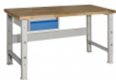
Kontejner 1 zásuvka +2 155 Kč